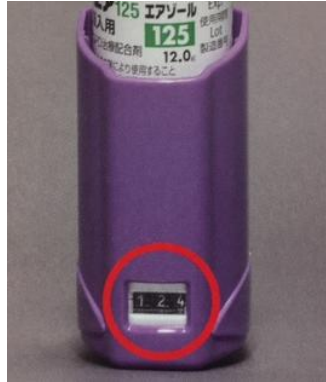
アドエア125 エアリアル など