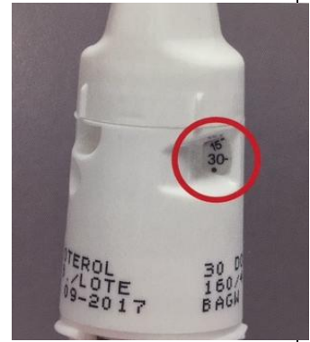
パルミコート・シムビコート コート タビ ユイラ-