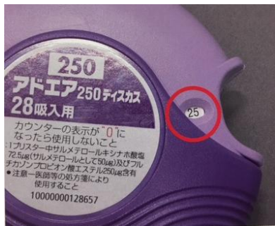
アドエアディスクスなど